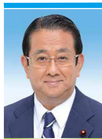
公明党横浜市議員

市長は「液体ミルクは、発災初期の授乳が容易に行えることで、乳幼児がいる家庭の避難生活の不安軽減に有効である。賞味期限が短いという課題が解消されたことから、地域防災拠点への早期導入に向けて検討していく」と応じました。