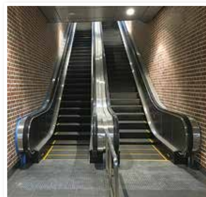
《エスカレーターの設置状況》