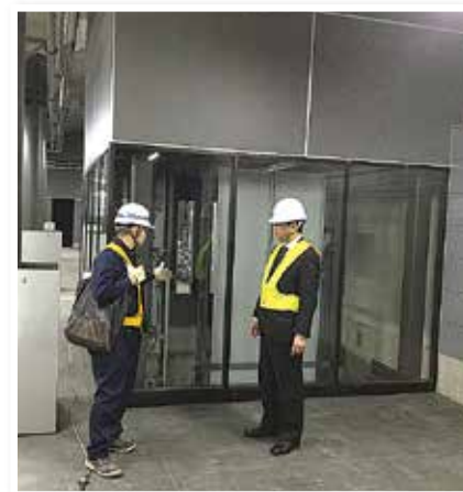
《エレベータの設置状況》