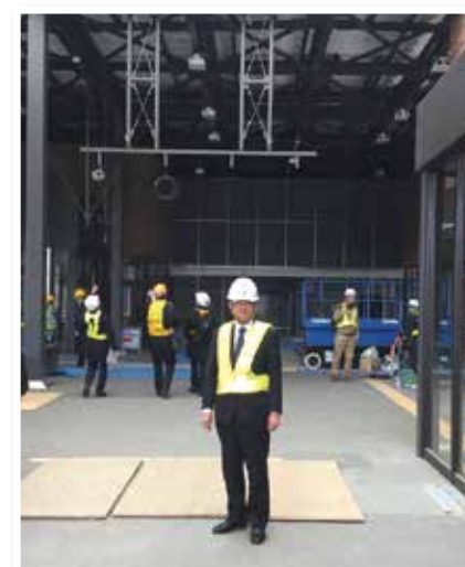
《駅構内の正面から》