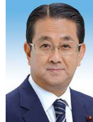
神奈川区政務調査会 公明党横浜市議員

駅名も「羽沢横浜国大駅」と命名され、既に相鉄・JR直通線のレールが全て繋がるまで、工事は進んでいます。今回は、羽沢横浜国大駅構内を視察しました。