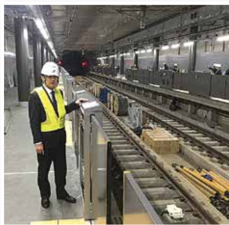
《ホームドアの設置状況》