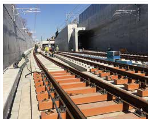
《線路はJR貨物線方面と東急線方面へ》