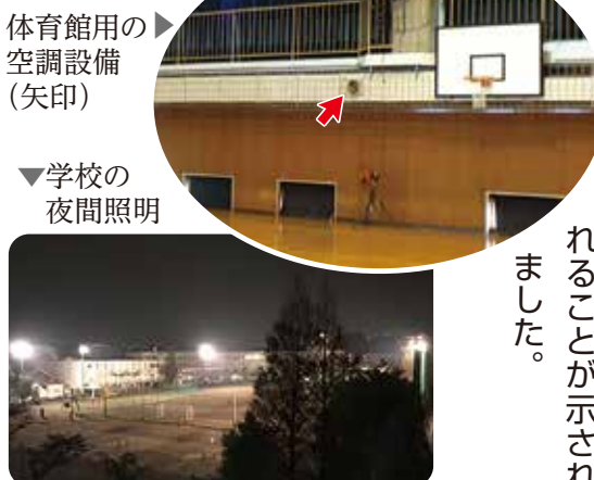
体育館用の空調設備 (矢印)

12月19日、公明党市議団は、市長および教育長に対し、市立学校体育館の空調設備設置の検討について申し入れを行いました。近年の夏の猛暑を踏まえ、特別教室への空調設備設置完了を急ぐとともに、災害時の避難場所としても活用される学校体育館への設置検討を早急に進めるよう要望しました。