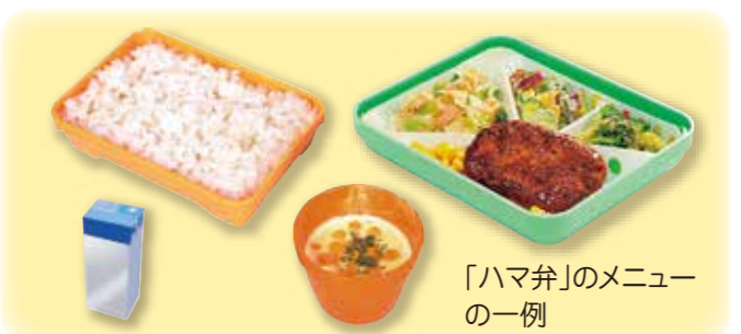
「ハマ弁」のメニューの一例

4月より値下げされ利用しやすくなったハマ弁。公明党市議団の要望により、当日注文について、今後、モデル校での実施結果を踏まえ、全校で実施できるように検討しています。